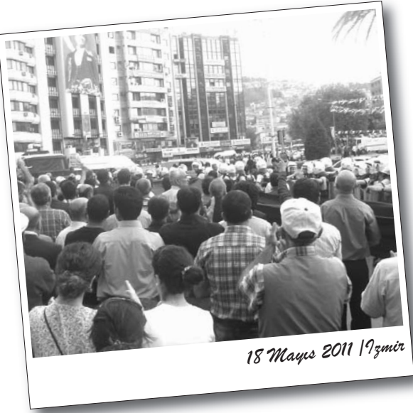
18 Mayıs 2011 İzmir

Şırnak'ın Uludere ilçesinde 12 HPG gerillasının katledilmesinin ardından Kürt halkı öfkelerini militan sokak eylemleriyle gösterdi. Azgın polis terörüne konu olan eylemlerde Kürt halkı gerillalara sahip çıktığını göstererek, devletin katliamcı yüzünü ve imha-inkar politikalarını lanetledi.